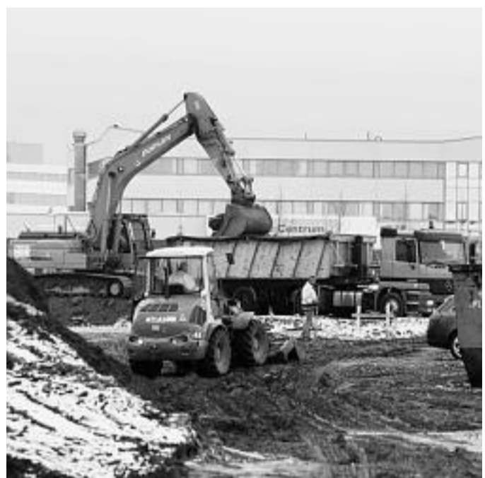
Bauarbeiten an der Saganer Straße in Teltow.

len lassen. Zu DDR-Zeiten gehörte das Gelände zum Kombinat Elektronische Bauelemente Carl von Ossietzky Teltow, das elektronische Widerstände herstellte. Größere Bodenverschmutzungen seien nicht festgestellt worden, sagte ttt-Chef Pietsch. Die Schäden bewegten sich „im Rahmen des Üblichen“.