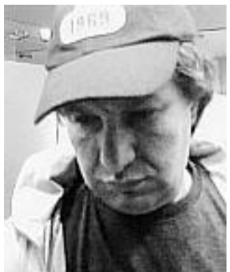
Nach diesem EC-Karten-Dieb sucht die Polizei.

Als dies nicht gelang, versuchte er es in einer weiteren Bank in der Otto-Suhr-Allee. Auch dort hatte der Einbrecher keinen Erfolg. Da die